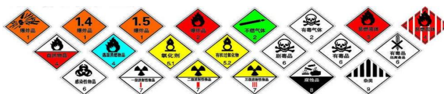
图2 危险化学品的分类及标志